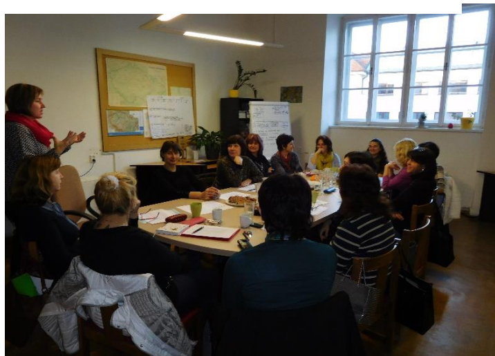
Setkání ředitelk a vedoucích učitelek mateřských škol z Písecka dne 29. ledna 2018