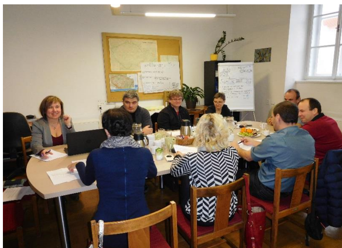
Setkání ředitelk a ředitelů základních škol z Písecka dne 7. února 2018