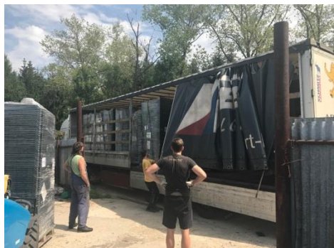
Distribuce kompostérů do obcí