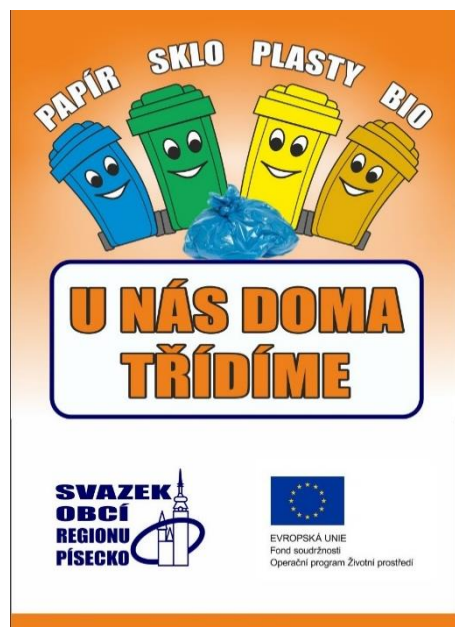
Samolepka pro domácnosti v rámci osvěty

Projekt se zaměřuje na snížení měrné produkce odpadů v jednotlivých obcích a městech, na zlepšení systému odděleného sběru a manipulace s odpady a na zajištění jejich využití. „Díky novým kontejnerům a nádobám na tříděný odpad zmodernizujeme vybavení měst a obcí a zvýšíme kapacitu sběrných nádob dle potřeb zapojených obcí“ upřesňuje Helena Šedivá ze Svazku obcí regionu Písecko.