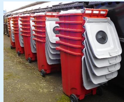
Nádoby města Písek