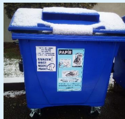
Kontejner v obci Zvíkovské Podhradí