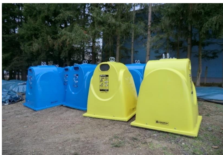
Část dodaných kontejnerů na papír a plast do Milevska

Občané obcí v regionu svazku obcí mohou lépe třídit odpad a zkrátí se jim vzdálenost ke kontejnerům či nádobám na tříděný odpad. Většinu nákladů na jejich pořízení pokryla dotace ve výši více než 4,3 milionů korun z Operačního programu Životní prostředí, kterou získal Svazek obcí regionu Písecko.