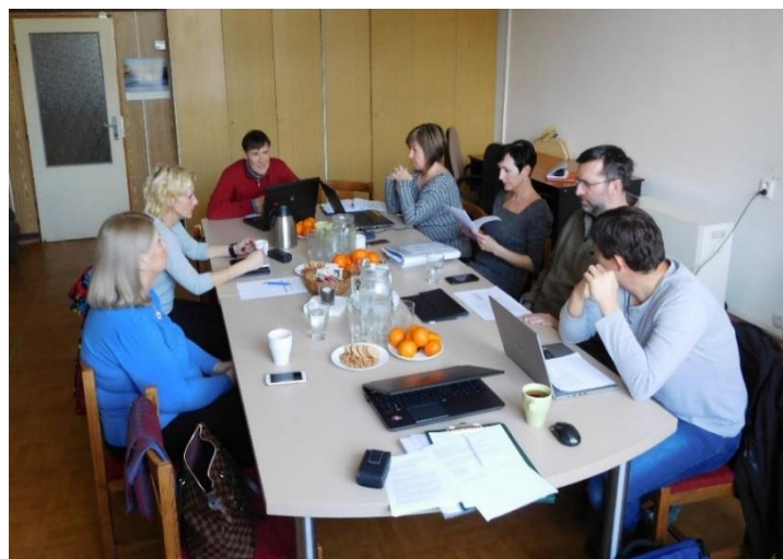
Jednání se zástupci Domu dětí a mládeže Písek, Městské knihovny Písek a ZUŠ O. Ševčíka Písek dne 31. ledna 2018

SORP v minulých dvou letech úspěšně zahájil proces plánování rozvoje vzdělávání na Písecku realizací projektu MAP, byla nastavena komunikace a spolupráce jednotlivých aktérů ve vzdělávání, aktivně se zapojila všechna školská zařízení pro děti a žáky do 15 let, Dům dětí a mládeže, Městská knihovna Písek, ZUŠ O. Ševčíka Písek, skauti, Technologické centrum Písek, vodácký oddíl, centrum NADĚJE, LezeTop Písek a řada dalších včetně zřizovatelů školských zařízení – jednotlivých obcí. Během společných setkání, vzdělávacích akcí a pracovních skupin společně zhodnotili situaci ve vzdělávání na Písecku a nastavili prostřednictvím strategického dokumentu cestu, co a jak je potřeba zlepšit, co chybí, v čem si mohou školy vzájemně pomoci a v čem potřebují pomoc zvenčí. V rámci MAP II bude tento proces nadále pokračovat. V jaké míře a zda se podaří zajistit vše, co si školy, školky a další organizace do MAP II naplánovaly, bude také záviset na hodnocení předložené žádosti. Držme si tedy palce!