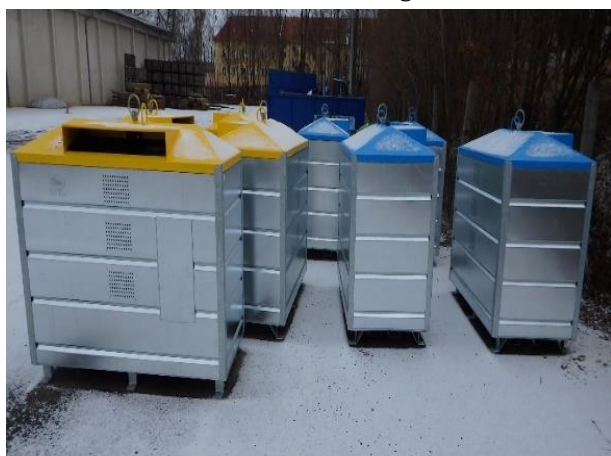
Kontejnery v obci Drhovle

Občané obcí v regionu svazku obcí mohou lépe třídit odpad a zkrátí se jim vzdálenost ke kontejnerům či nádobám na tříděný odpad. Většinu nákladů na jejich pořízení pokryla dotace ve výši více než 4,3 milionů korun z Operačního programu Životní prostředí, kterou získal Svazek obcí regionu Písecko.