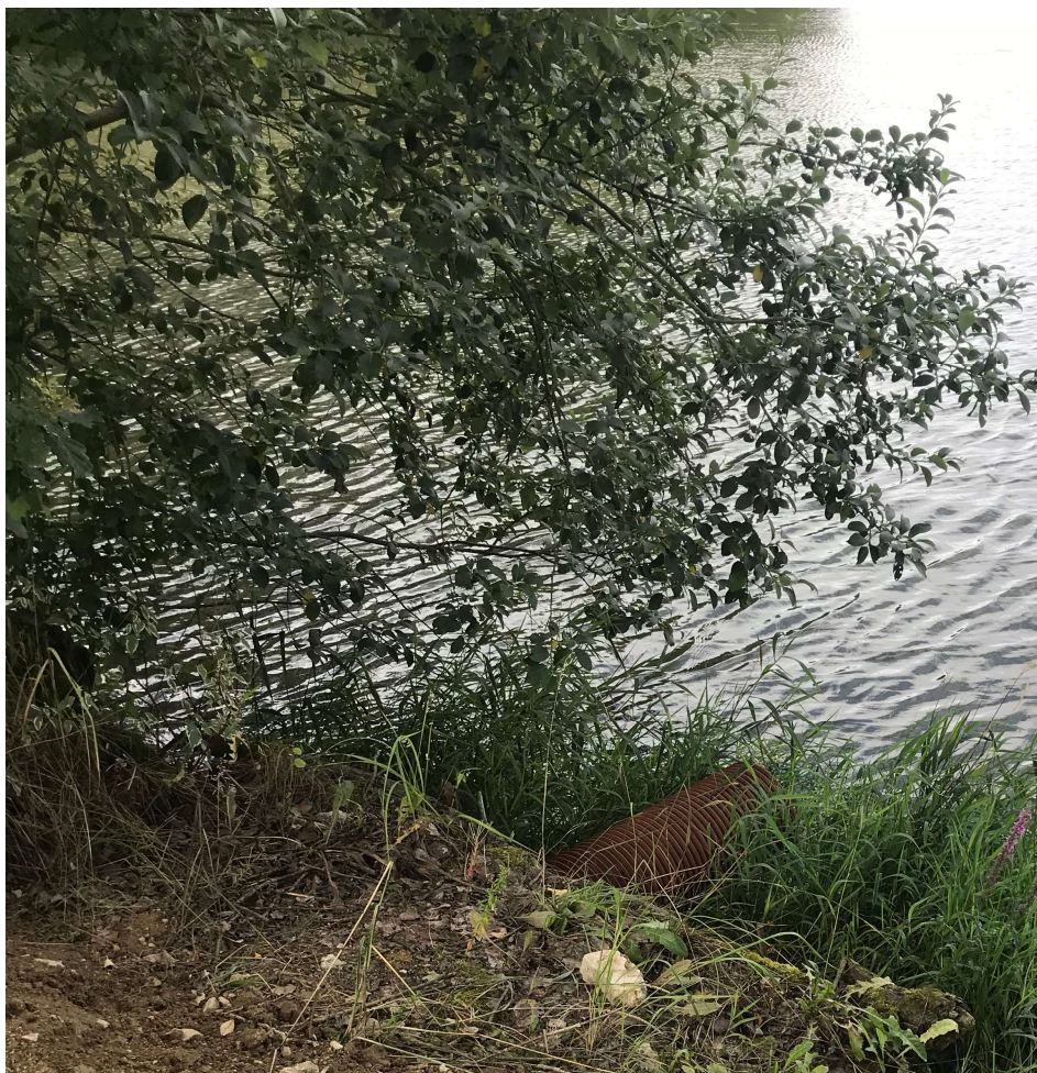
vyústění do Ostrovského rybníku