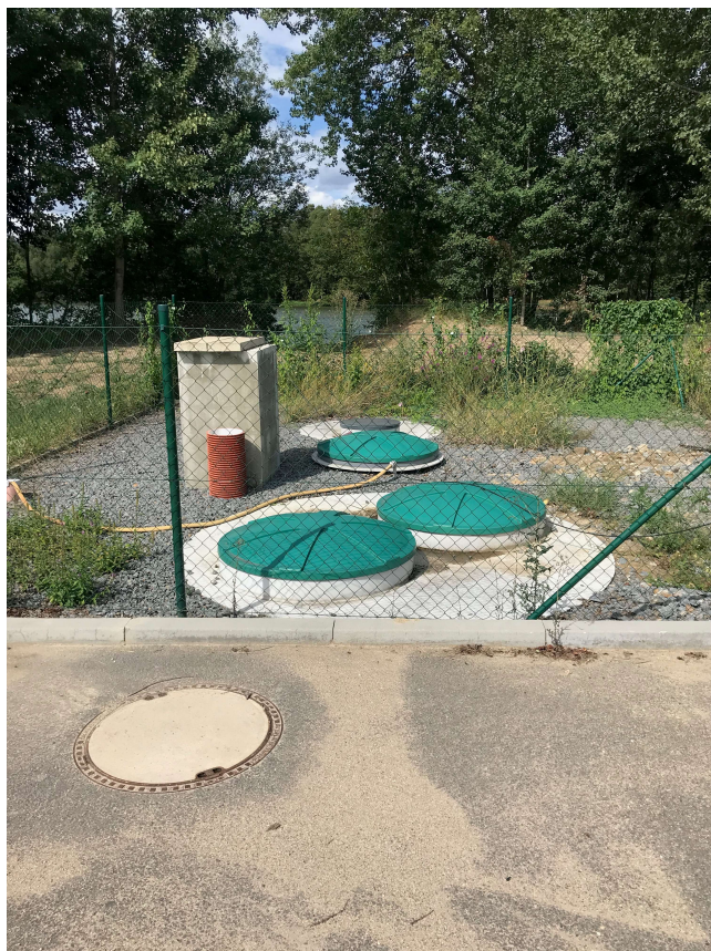
ČOV v severovýchodní části obce