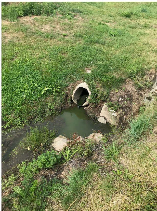
Volné vyústění při pozemní komunikaci (směr Stehlovice) do Branického potoka