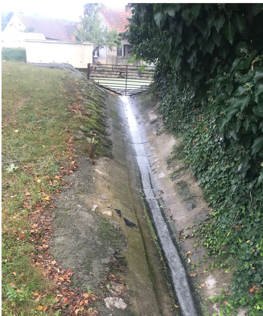
přepad z rybníka