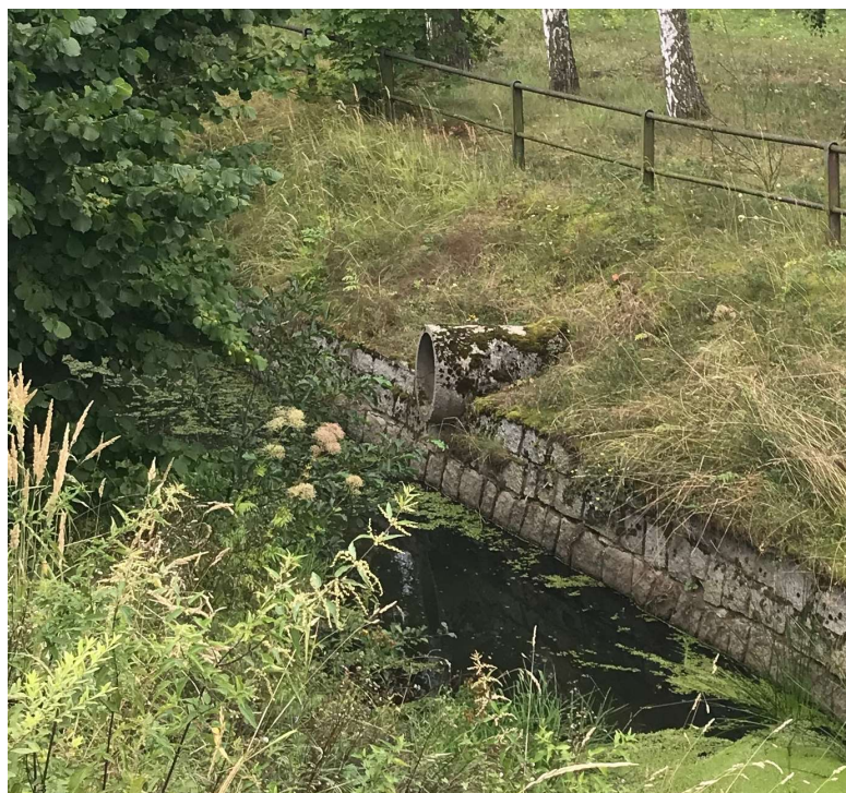
volné výústění jižní části stokové sítě obce Skály sítě (nedaleko rybníka)