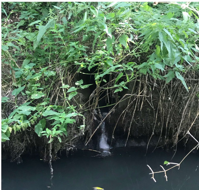
volné výústění jižní části stokové sítě obce Skály (východně od obce)