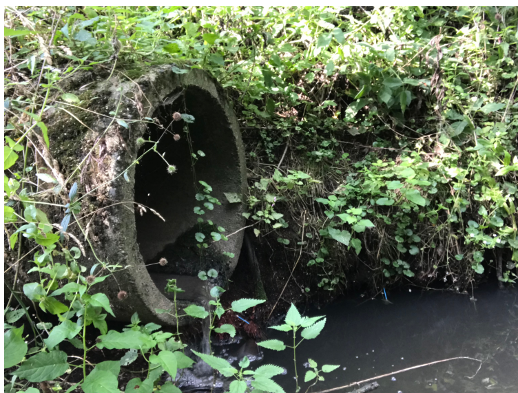
volné vyústění severní části stokové sítě v obci Skály

V části Budičovice se nachází jednotná kanalizační síť s hlavní stokou vybudovanou z betonových trubek DN 400 vedoucí z jihovýchodní části přes náves a ústící u mostu do Skalského potoka.