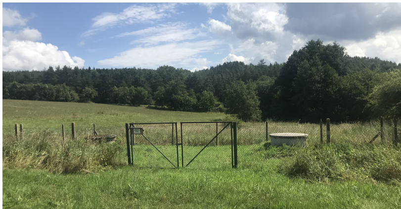
vlevo likvidovaný vrt, vpravo vrt zásobující obec pitnou vodou

Většina místního vodovodního potrubí je provedena z plastového potrubí. Na vodovodním řadu jsou umístěny hydranty.