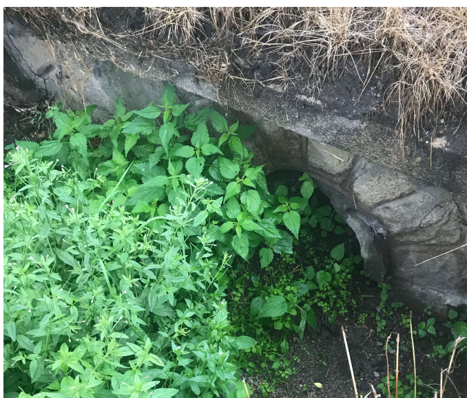
volné vyústění u kraje silnice I/29

V severní části obce je odvedena odpadní voda od objektu č.p. 7 směrem na sever stokou z plastového potrubí DN 200. Stoka volně ústí do otevřené vodoteče.