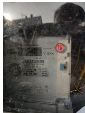
Obr.7 RVO Bernartice – celkový pohled a detail elektroměru

RVO Srlín (výrobce LOGAREX, LK13BO607037) je umístěn ve skříni ve zdi objektu trafostanice společnosti E.ON v části Srlín u čísla popisného 67.