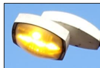
Obr.4 Svítidlo typ 41, 42, 43, 44