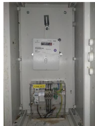
Obr.9 RVO Kolišov – celkový pohled na elektroměr

RVO Jestřebice (výrobce Itron, ACE1000 Typ 270) je umístěn ve skříni na příhradovém stožáru společnosti E.ON v části Jestřebice u čísla popisného 37.