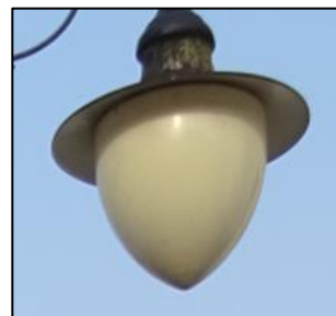
Obr.3 Svítidlo typ 23, 36, 39, 40