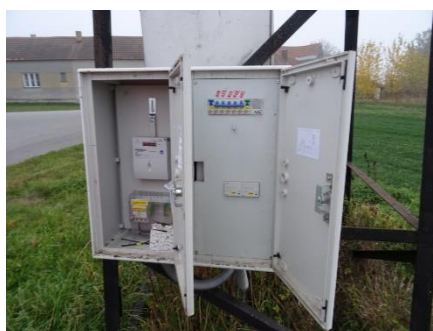
Obr.10 RVO Jestřebice – celkový pohled a detail elektroměru

RVO Jestřebice (výrobce Itron, ACE1000 Typ 270) je umístěn ve skříni na příhradovém stožáru společnosti E.ON v části Jestřebice u čísla popisného 37.