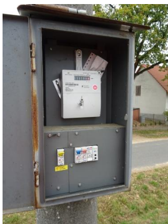
Obr.14 RVO Rakov – celkový pohled na elektroměr

RVO Rakov (blíže neurčeného typu) je umístěn ve skříni na betonovém sloupu společnosti E.ON v části Rakov u čísla popisného 6.