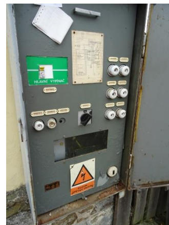
Obr.11 RVO Zběšice – celkový pohled na elektroměr

RVO Zběšice (blíže neurčeného typu) je umístěn ve skříni ve zdi objektu trafostanice společnosti E.ON v části Zběšice u čísla popisného 30.