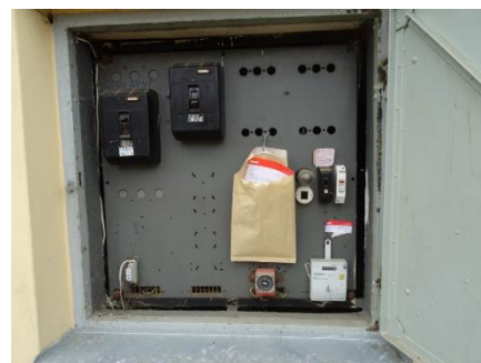
Obr.13 RVO Bilinka – celkový pohled na elektroměr

RVO Bilinka (blíže neurčeného typu) je umístěn ve skříni ve zdi objektu trafostanice společnosti E.ON v části Bojenice u čísla popisného 4.