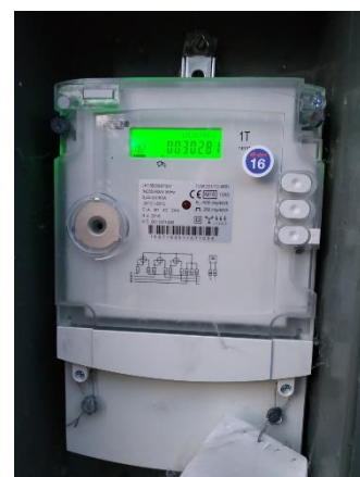
Obr.8 RVO Srlín – celkový pohled a detail elektroměru