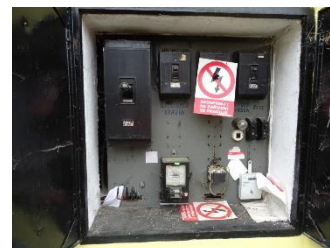
Obr.12 RVO Bojenice – celkový pohled a detail elektroměru

RVO Bilinka (blíže neurčeného typu) je umístěn ve skříni ve zdi objektu trafostanice společnosti E.ON v části Bojenice u čísla popisného 4.