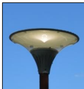
Obr.6 Svítidlo typ 61, 62, 94