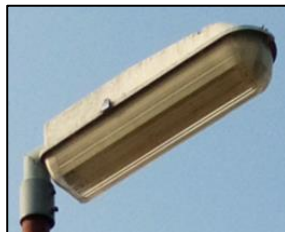
Obr.1 Svítidlo typ 4, 5, 6 (více popisu v tabulkové příloze)