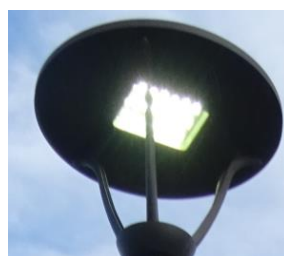
Obr.2 Svítidlo typ 50, 51, 52 (více popisu v tabulkové příloze)