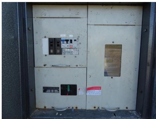
Obr.5 RVO Chlaponice - detail elektroměru

RVO Chlaponice (výrobce ZPA, ZE114.D0.A1B111-081) je umístěn ve zděném pilíři v části Chlaponice u čísla popisného 10.