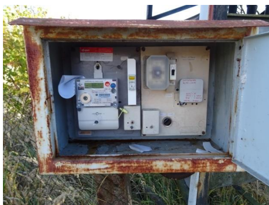
Obr.7 RVO Dubí Hora - detail elektroměru

RVO Dubí Hora (výrobce ZPA, ZE114.D0.A1B111-081) je umístěn ve skříni na příhradovém stožáru společnosti E.ON v části Dubí Hora u čísla popisného 62.