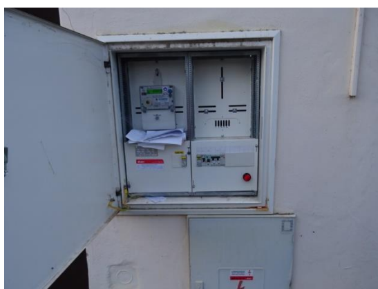
Obr.10 RVO Brloh - detail elektroměru

RVO Brloh (výrobce ZPA, ZE114.D0.A1B111-081) je umístěn ve skříni na zdi hasičské zbrojnice v části Brloh u čísla popisného 29.