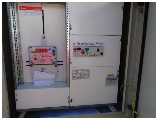
Obr.4 RVO Mlaka - detail elektroměru

RVO Chlaponice (výrobce ZPA, ZE114.D0.A1B111-081) je umístěn ve zděném pilíři v části Chlaponice u čísla popisného 10.