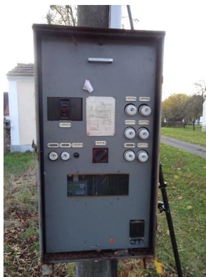
Obr.9 RVO Pamětice - detail elektroměru

RVO Brloh (výrobce ZPA, ZE114.D0.A1B111-081) je umístěn ve skříni na zdi hasičské zbrojnice v části Brloh u čísla popisného 29.