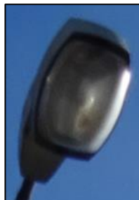
Obr.1 Svítidlo typ 8, 48, 49 (více popisu v tabulkové příloze)