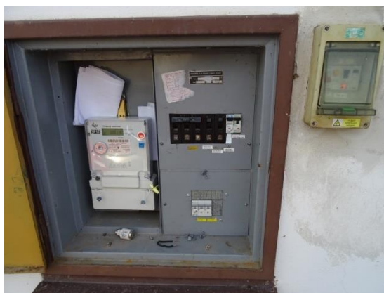
Obr.8 RVO Pamětice - detail elektroměru

RVO Nedílná (výrobce ZPA, ZE114.D0.A1B111-081) je umístěn ve skříni na betonovém sloupu společnosti E.ON v části Nedílná u čísla popisného 37.