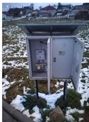
Obr.3 RVO Na Mateři – celkový pohled a detail elektroměru

RVO Na Mateři (výrobce Itron, ACE1000 type 100) je umístěn ve skříni u čísla popisného 126.