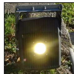
Obr.1 Svítidlo typ 6, 14, 16, 35 (více popisu v tabulkové příloze)