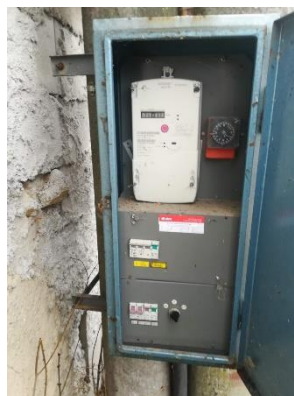
Obr.2 RVO Heřmaň obec - celkový pohled a detail elektroměru

RVO Heřmaň obec (výrobce ACTARIS, ACE3000 type 100) je umístěn ve skříni na betonovém sloupu společnosti E.ON u čísla popisného 16.