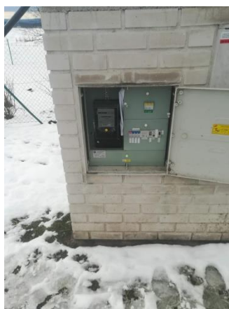
Obr.2 RVO Podolí – celkový pohled a detail elektroměru

RVO Podolí (výrobce ACTARIS, C114UX7R) je umístěn ve skříni v cihlovém pilíři společnosti E.ON v části Podolí u čísla popisného 24.