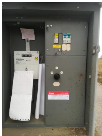
Obr.3 RVO Rastory – celkový pohled a detail elektroměru

RVO Rastory (výrobce ACTARIS, ACE1000 Typ 270) je umístěn ve skříni na betonovém sloupu společnosti E.ON směrem k číslu popisnému 13.