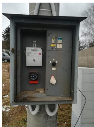
Obr.4 RVO Horní Rastory – celkový pohled a detail elektroměru

RVO Horní Rastory (výrobce Itron, ACE1000 Typ 270) je umístěn ve skříni na betonovém sloupu společnosti E.ON v části Horní Rastory u čísla popisného 31.