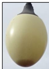
Obr.1 Svítidlo typ 6, 8, 44, 59, 64 (více popisu v tabulkové příloze)