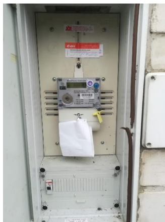
Obr.5 RVO Podolsko – celkový pohled a detail elektroměru

RVO Podolsko (výrobce ZPA, ZE114.D0.A1B111-081) je umístěn ve skříni v cihlovém pilíři společnosti E.ON v části Podolsko u čísla popisného 76.