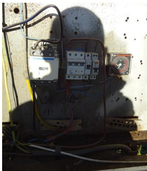
Obr.2 RVO celkový pohled a detail elektroměru