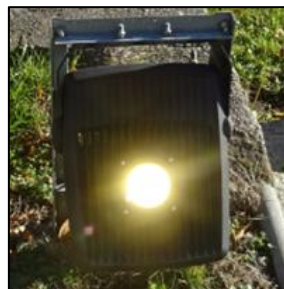
Obr.1 Svítidlo typ 6, 34, 35 (více popisu v tabulkové příloze)