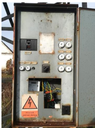
Obr.3 RVO Podelhota – celkový pohled a detail elektroměru

RVO Podelhota (výrobce Itron, ACE1000 Typ 270) je umístěn ve skříni na příhradovém stožáru společnosti E.ON v části Podelhota u čísla popisného 106.