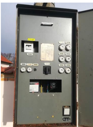
Obr.4 RVO Vrábsko – celkový pohled a detail elektroměru

RVO Vrábsko (výrobce ELGAS, typ EL 103 s) je umístěn ve skříni na betonovém sloupu společnosti E.ON v části Vrábsko u čísla popisného 18.