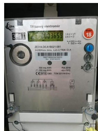
Obr.2 RVO Smetanova Lhota – celkový pohled a detail elektroměru