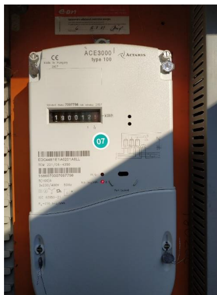
Obr.2 RVO celkový pohled a detail elektroměru