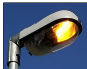
Obr.1 Svítidlo typ 6, 20, 21, 25 (více popisu v tabulkové příloze)