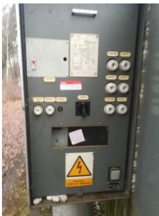
Obr.2 RVO Zvíkovské Podhradí I. – celkový pohled a detail elektroměru

RVO Zvíkovské Podhradí I. (výrobce ACTARIS, blíže neurčený typ) je umístěn ve skříni na betonovém sloupu společnosti E.ON u čísla popisného 7.