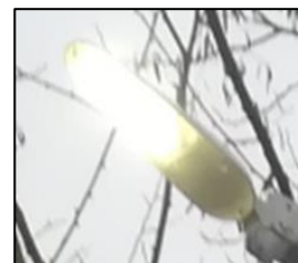
Obr.1 Svítidlo typ 6, 44, 63, 78 (více popisu v tabulkové příloze)