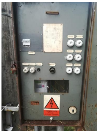
Obr.3 RVO Zvíkovské Podhradí II. – celkový pohled a detail elektroměru

RVO Zvíkovské Podhradí II. (výrobce LOGAREX, typ LK13BO407037) je umístěn ve skříni na betonovém sloupu společnosti E.ON směrem k číslu popisnému 92.