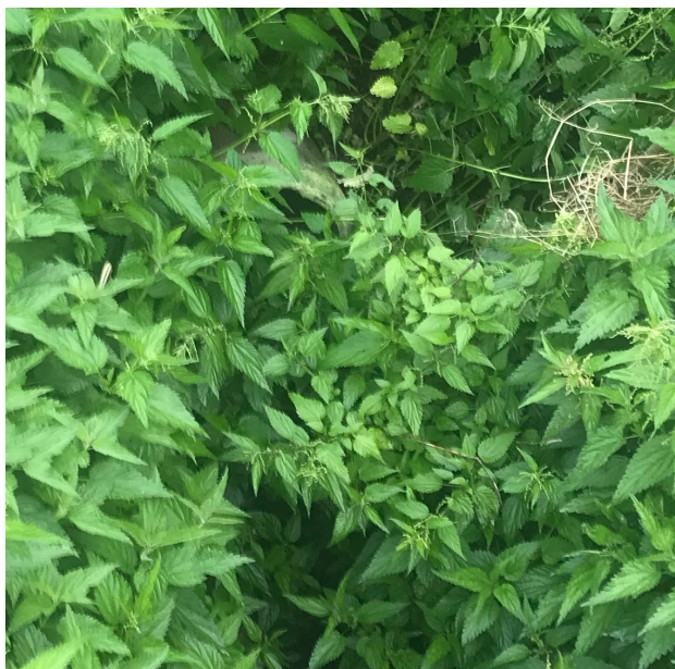
volné vyústění východní stoky