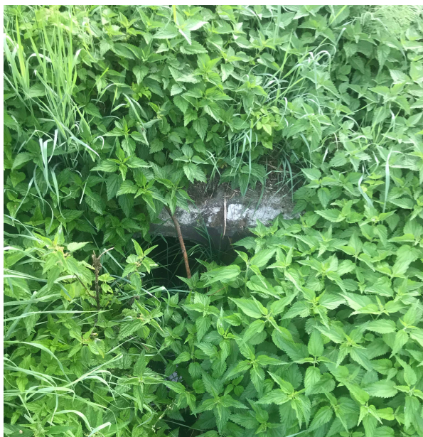
volné vyústění do otevřené vodoteče

Kanalizační síť v části Blehov je řešena jednotnou stokou zhotovenou z betonového potrubí DN 300. Stoka začíná u budovy č.p. 4 a vede přes křižovatku směrem na západ, kde za obcí volně ústí do otevřené vodoteče.