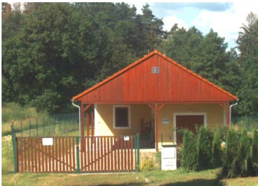
ČOV Zvíkovské podhradí