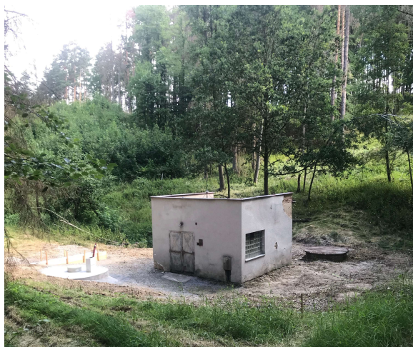
nově budovaný vrt